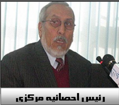
رئیس احصائیه مرکزی

مسئولان اداره احصائیه می گویند قرار است تا دو ماه دیگر سرشماری سراسری نفوس در کشور آغاز شود. قرار است این برنامه توسط حدود سی هزار نفر در ظرف بیست و دو روز انجام داده شود. مسئولین می گویند اگر وضعیت امنیتی در افغانستان قناعت بخش نباشد، برنامه سرشماری در برخی از مناطق نا امن کشور اجرا نخواهد شد. همچنان گفته اند میلیون ها افغان که در حال حاضر خارج از افغانستان بسر می برند نیز شامل برنامه جدید سرشماری نفوس نیستند و این موضوع مشکل دیگری را سر راه برنامه سرشماری قرار داده است. این نخستین بار در سه دهه اخیر خواهد بود که سرشماری در سراسر افغانستان اجرا می گردد. در حالیکه باید در هر ده سال یک بار سرشماری صورت گیرد اما به دلیل نا امنی و بحران های چند دهه گذشته، اجرای سراسری این برنامه ناممکن بوده است.